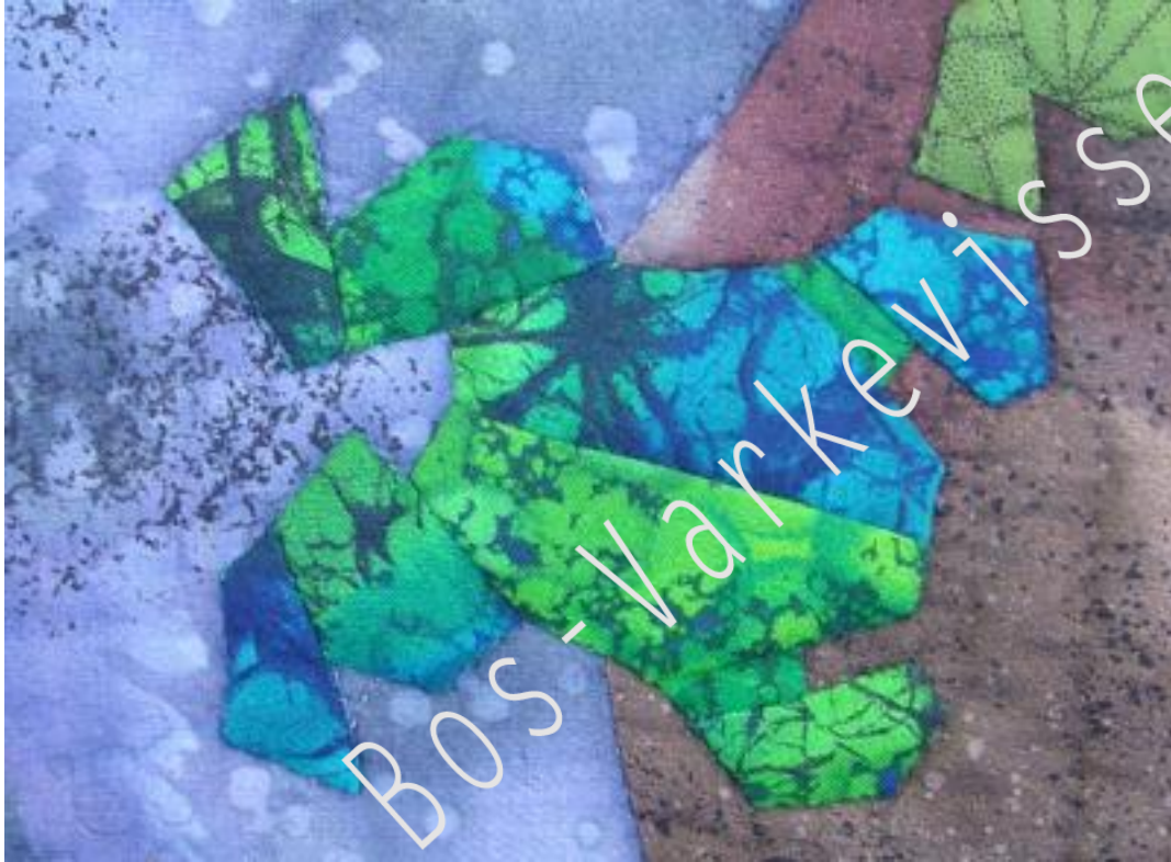
Het linker- en rechterachterpootje zitten verschillend aan de kikker